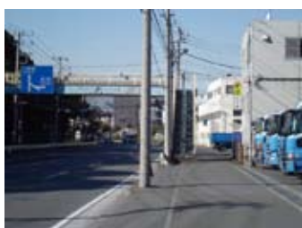
降車して左側に歩道橋が見えます。