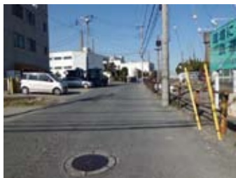
踏切を渡らず手前を左折。