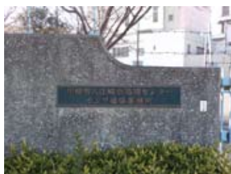
左折の目印は入江崎水処理センター ポンプ場係事務所