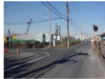
線路沿いをしばらく歩きT字路を左折