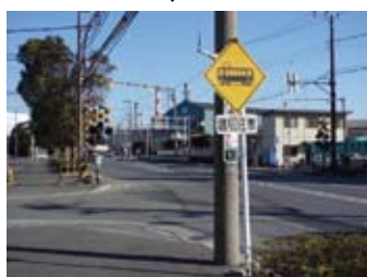
右折してすぐに踏切。