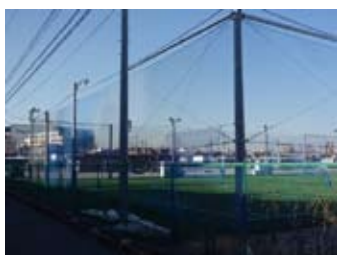
すぐに右手にコートが見えます。